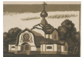
Gravur A. Romanow 1992 Fljonovo Kirche Smolensk

An dieser Stelle möchten wir alle Initiativen bitten, ihre Termine per E-Mail mitzuteilen, wir veröffentlichen sie dann.