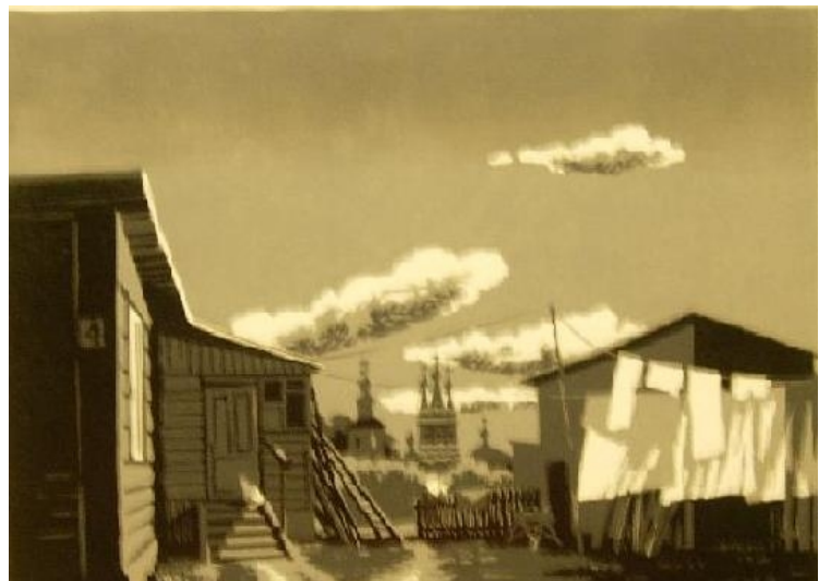
Gravur von Alexander Romanow 1992 Odigitria Kirche Wjasma