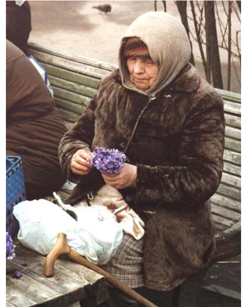
Veilchenverkauf 1992 in Smolensk

In dem Maße wie sich der Eisene Vorhang öffnete, nutzen „Pioniere der ersten Stunde“ aus unsere Stadt, Kontakte mit Gruppen in Smolensk aufzunehmen, dorthin zu reisen und Möglichkeiten zu erkunden, die gewon-