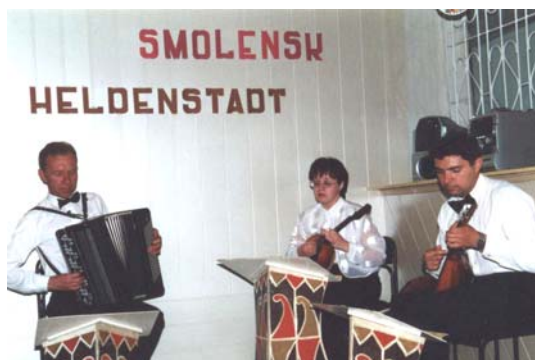
Balalaika-Trio während des Glinka-Festivals im Jahre 2000 im Zentrum Deutscher Kultur

„Mitgliedern“ gegründet. Im Sinne der Vereingründer und der davor für Smolensk Tätigen wurde unser Verein kontinuierlich weitergeführt, wobei die Humanitäre Hilfe sich wandelte, aber nie in Frage gestellt wurde. Dazu gab es immer Aktionen insbesondere der jüngeren Bürger beider Städte, wie auf dem Gebiet der Schulen und Hochschulen, Kinder-/Theater, Sport, Musik, Kirchengemeinden usw.